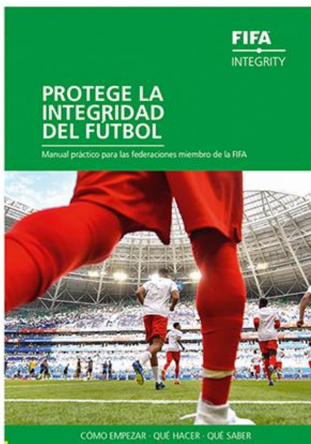
01 Manual práctico de integridad de la FIFA