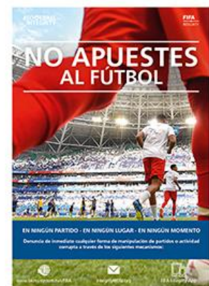
03 Pósteres de integridad de la FIFA